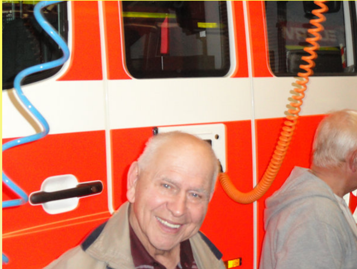
Besuch der Freiwilligen Feuerwehr Butzbach