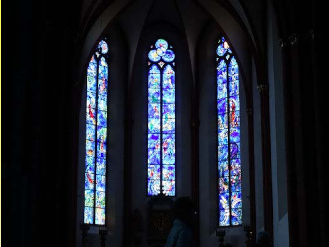
St. Stephan Mainz Fenster von Marc Chagall